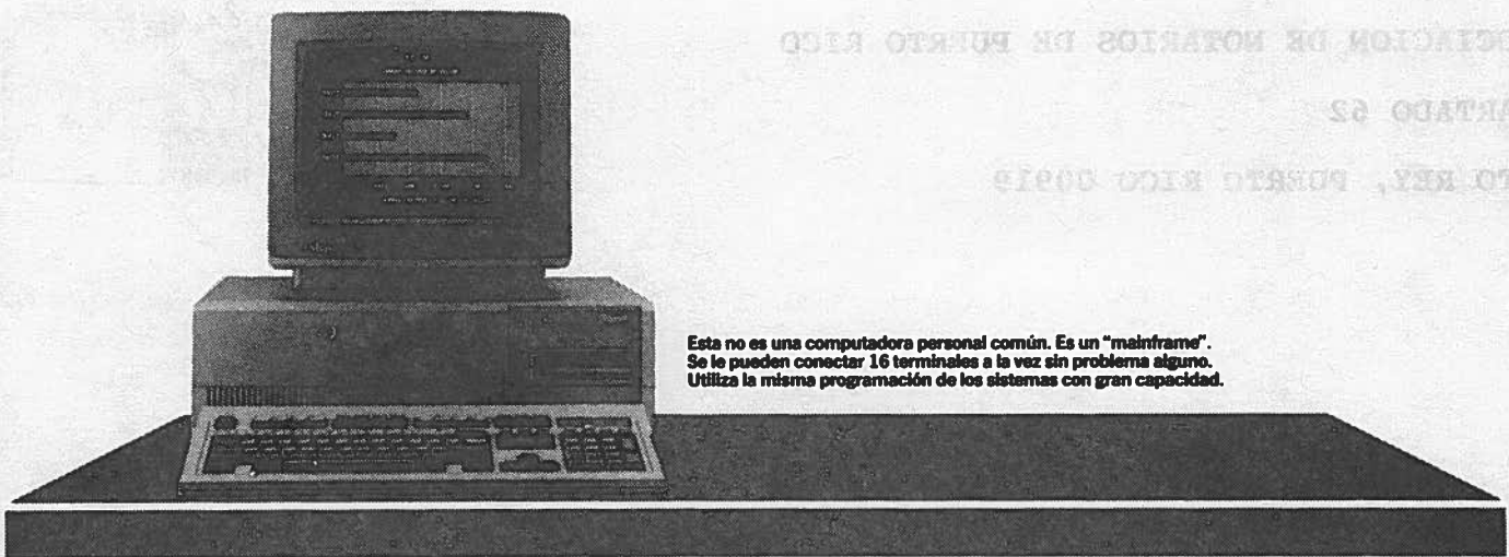
Esta no es una computadora personal común. Es un "mainframe". Se lo pueden conectar 16 terminales a la vez sin problema alguno. Utiliza la misma programación de los sistemas con gran capacidad.