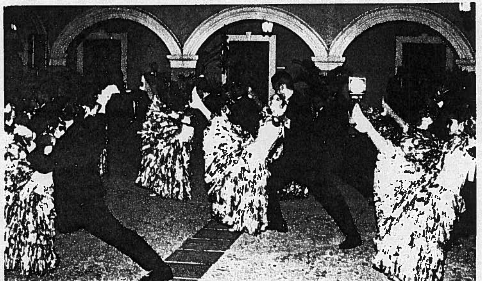
DE LA ACTIVIDAD