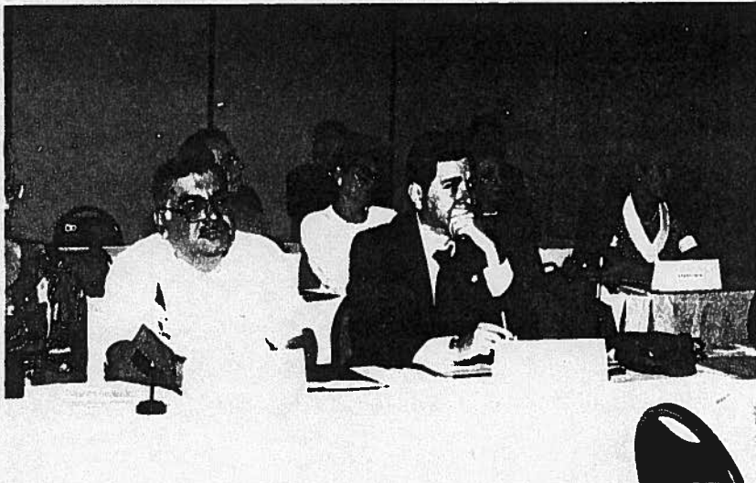
GUATEMALA, HONDURAS, VENEZUELA