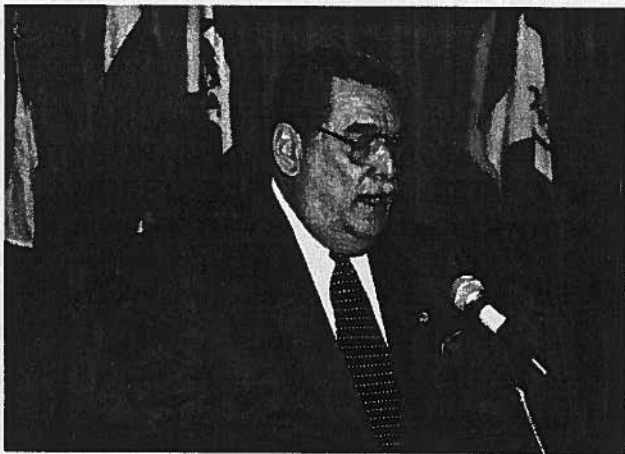
El Hon. José A. Andreu García se dirige a los asistentes de la IX Jornada Notarial.

La celebración de esta Jornada Notarial, la segunda en su tipo que se lleva a cabo en Puerto Rico, adelanta una vez más el compromiso asumido desde su fundación por la Unión Internacional del Notariado Latino, de promover y coordinar la más estrecha colaboración entre los notariados. Agrupa esta jornada países de diversos orígenes étnicos y culturales. Pero sus notariados coinciden en aquellos principio, normas y valores que respaldan la antigua y noble tradición de atestar o dar fe. Aunque apreciados en forma individual se perciba que sus gobiernos e incluso su organización social responde a sistemas políticos y económicos distintos, lo cierto es que coinciden en la misión primaria señalada. Su representante, la Unión, órgano institucional del notariado latino, los agrupa y garantiza la continuidad de este sistema notarial.